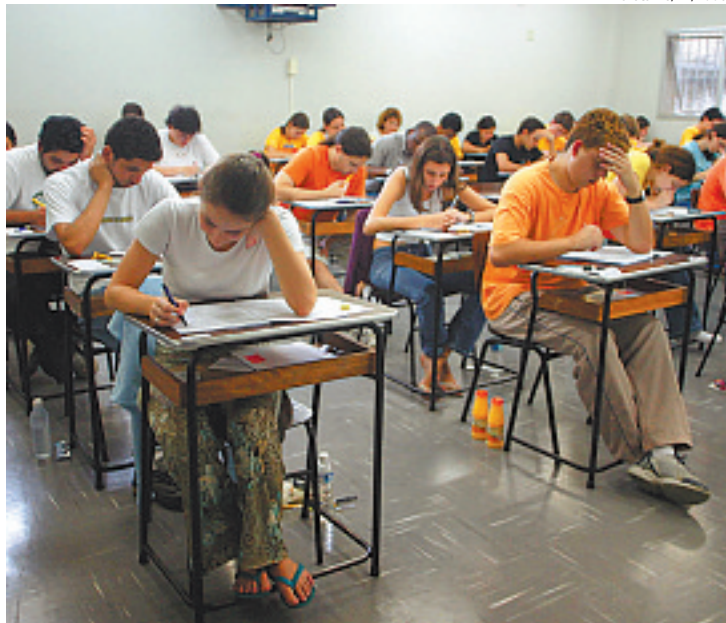
Tranquilidade na hora do processo seletivo pode garantir aprovação

E studantes prestes a ingressar no Ensino Superior começam a viver momentos de tensão. Nos próximos meses, as universidades realizam os vestibulares do meio de ano.