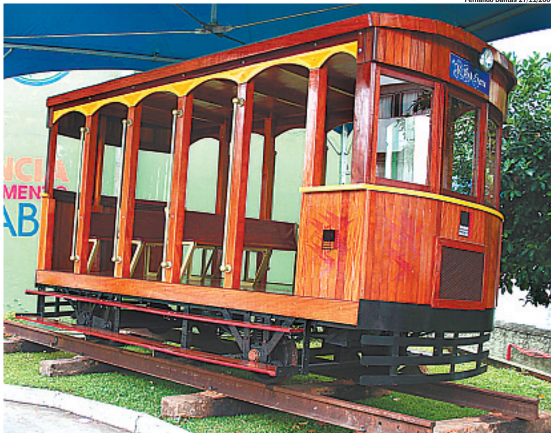
Bondinho de Rio Grande da Serra é um exemplo de patrimônio público que foi restaurado

Segundo o professor, o mercado para quem deseja se tornar um restaurador está aquecido, principalmente para aqueles que têm espírito empreendedor, mas ainda não na mesma proporção que para os arquitetos. “A arquitetura, em geral, cresceu muito, mas o segmento dos restauradores ainda está em evolução.”▲