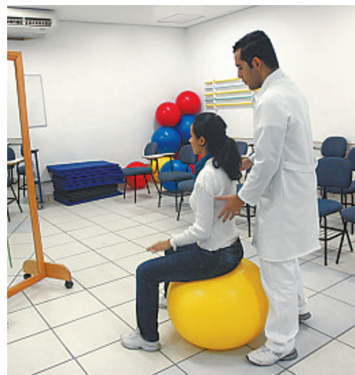
Profissões ligadas à área da saúde ainda estão em alta no mercado